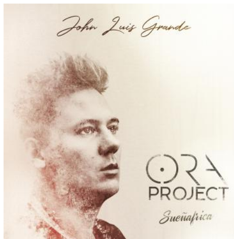
Ora project « Suenafrika » (2018)