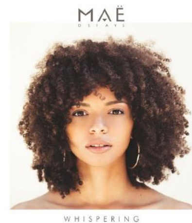
Maë Defays « Whispering » (2020)