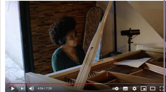
Crafting Quintet - Sérénité (composé par Clélya Abraham)