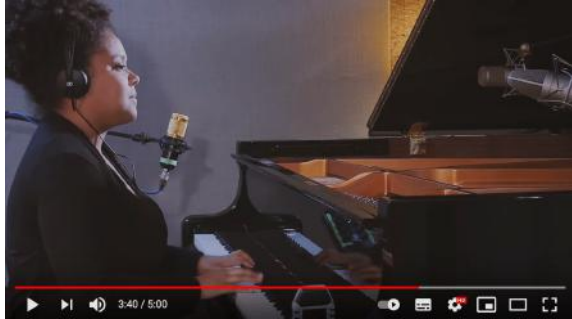
ABRAHAM RÉUNION - « Pa janmen oubliyé » - Studio