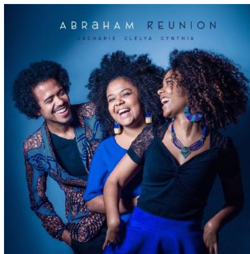
Abraham réunion « Abraham Réunion » (2020)